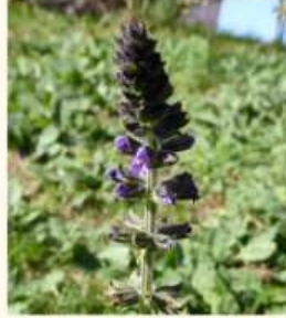
Salvia verbenaca , F. Hoffer