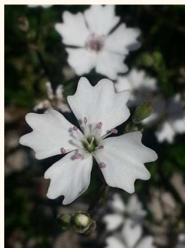
Silene quadrifida , Jean-Michel Bornand