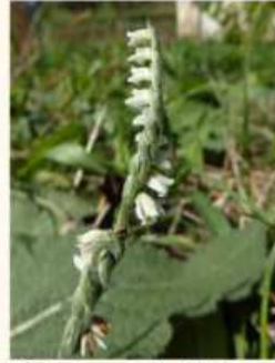
Spiranthes spiralis , F. Hoffer