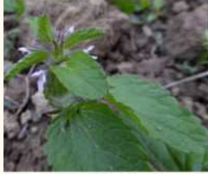
Stachys arvensis , F. Hoffer