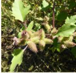
Xanthium orientale subsp. italicum , F. Hoffer