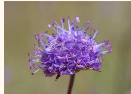
Succisa pratensis , Joëlle Magnin-Gonze